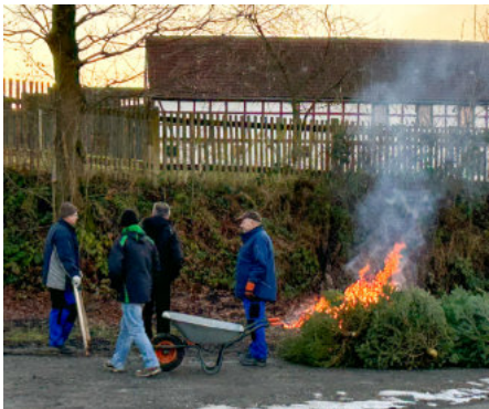
Eure FFW Dreba & das Elternaktiv

Die Glühweinkocher standen bereit, die Feuerstelle war vorbereitet und dann konnte es um 16.30 Uhr auch schon losgehen. Bis in die späten Abendstunden wurde das alte Jahr ausgewertet, zu die neuen Projekte sowie über „dies und das“ gesprochen. Ein schöner Ausklang.